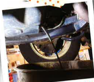
毎週土曜日(9:00▶15:00) お得な オイル交換デー!