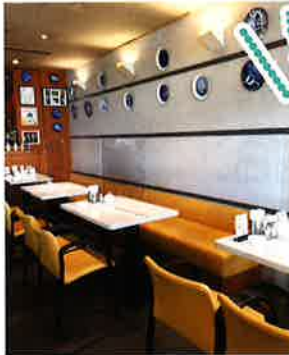
▲ 広く落ち着いた「店内」