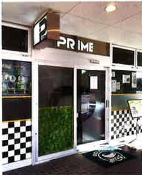
▲ スッキリ、シンプルな「外観」