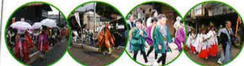
▲加茂まつり 御神幸行列の様子

リスがクワジの中で放し飼いをしております。 入園料 無料 開園時間 午前10時~午後4時 休園日 毎週月曜日(月曜日が祝日の場合は翌日休園します)