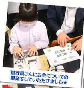
銀行員さんにお金についての授業をしていただきました★