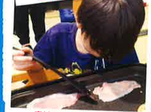
寄付していただいたお肉を自分たちで焼いて食べました!