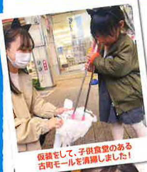
仮装をして、子供食堂のある古町モールを清掃しました!