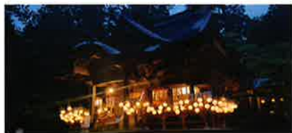
あかりまじり 涼しい夜のご参拝[6月末~7月初め開催]