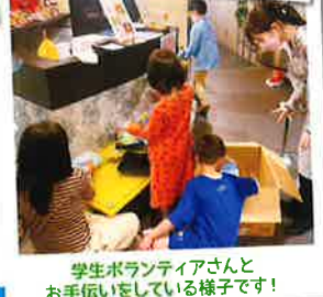
学生ボランティアさんとお手伝いしている様子です!