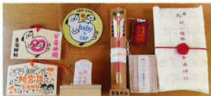
子授・安産・子守関係の授与品